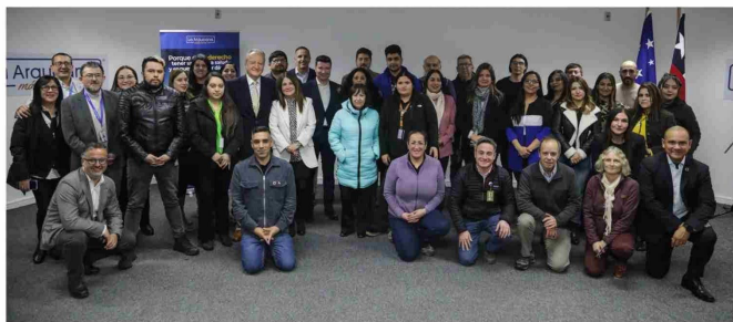
Lanzamiento del programa “Tu Salud Más Cerca”, con trabajadores.