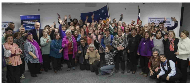
Lanzamiento de programa “Tu Salud Más Cerca”, con pensionados.