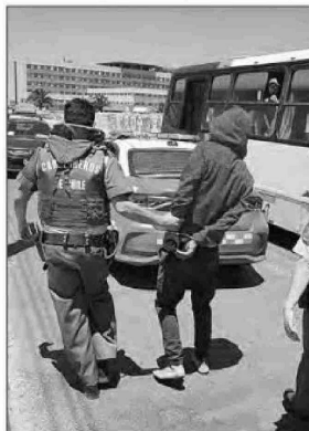
Los dos sujetos se resistieron a la fiscalización antes de ser detenidos por el personal de la Cuarta Comisaría de Carabineros.

Finalmente, el lunes 9 de diciembre, los dos sujetos pasaron a audiencia de control de detención en el Tribunal de Garantía de Quillota, donde el magistrado sometió a ambos a la medida cautelar de firma mensual a contar del próximo 16 de diciembre por todo el tiempo que se extienda la causa, con un plazo indefinido.