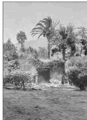
Este es el ruco que habitaban los dos individuos que habrían causado el incendio en las cercanías del Hospital Biprovincial.