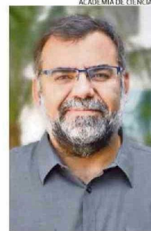
Baeza es ingeniero civil.

El experto, destacado a nivel internacional por su aporte en las disciplinas de la ciencia de datos y la inteligencia artificial (IA), es director de investigación en el instituto de IA Experiencial y miembro asociado del Network Science Institute de la Northeastern University.