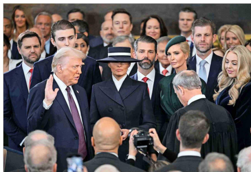
Luego de haber jurado “proteger la Constitución” sobre una Biblia heredada de su madre, bajo la cúpula del Capitolio, el 47° Presidente de Estados Unidos pronunció su primer discurso: delineó los ejes de su segunda administración, como la inmigración y la economía, además de anunciar que dará marcha atrás a diversas medidas de su antecesor, Joe Biden.

Declara “emergencia nacional” en la frontera con México, lo que le permitiría reforzar los controles con la presencia de militares.