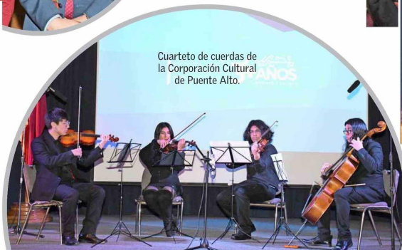
Cuarteto de cuerdas de la Corporación Cultural de Puente Alto.