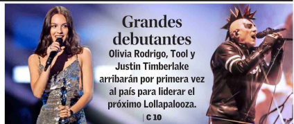
Grandes debutantes Olivia Rodrigo, Tool y Justin Timberlake arribarán por primera vez al país para liderar el próximo Lollapalooza. | C 10