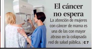
El cáncer no espera La atención de mujeres con cáncer de mama es una de las con mayor atraso en la colapsada red de salud pública. C 7