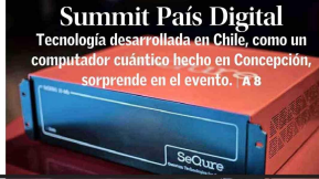
Summit País Digital Tecnología desarrollada en Chile, como un computador cuántico hecho en Concepción, sorprende en el evento. A 8