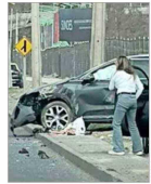
El vehículo sustraído a la víctima terminó chocado en avenida Santa María, donde impactó a otro automóvil.

Profesora asaltada por dos jóvenes en su casa de Vitacura: "Debian estar en el colegio (...). Me da mucha pena" | C 9