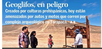
Geoglifos, en peligro Creados por culturas prehispánicas, hoy están amenazados por autos y motos que corren por complejo arqueológico en Tarapacá. A 8

FUNDADO EN SANTIAGO EL 1 DE JUNIO DE 1980 / AÑO CCXXV N° 44.958 (ES PROPIEDAD)