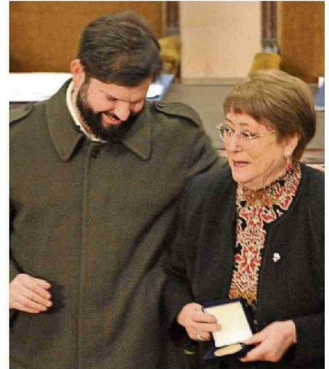
EL PRESIDENTE BORIC JUNTO A LA EXPRESIDENTA BACHELET, AYER, EN UN ACTO DEL CONSEJO DE RECTORES.