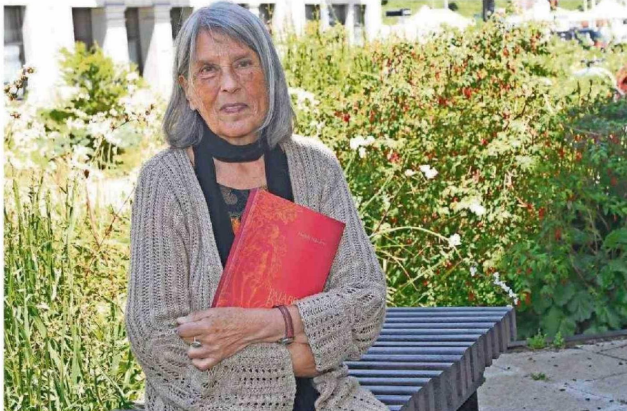
LA INTEGRANTE DEL COLECTIVO LOCAS MUJERES TAMBIÉN FUE MIEMBRO DEL DIRECTORIO DE LA SOCIEDAD DE ESCRITORES DE CHILE.

El año pasado la Fundación Plagio abrió las postulaciones para un premio sobre el impacto creativo de artistas nacionales vivos, específicamente de aquellos ligados a las artes visuales y la literatura. La invitación fue a que la comunidad en