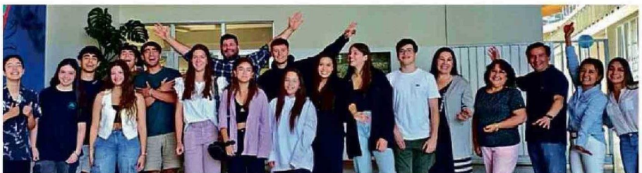
ESTUDIANTES EGRESADOS DEL LYCÉE CLAUDE GAY DE OSORNO CELEBRARON ESTE HITO OBTENIDO EN LA PAES DE ESTE AÑO.

los puntajes y en nuestro colegio también, al igual que la tendencia nacional. Lo bueno es que 48 estudiantes rindieron la prueba en nuestro colegio este año y 17 de ellos tienen más de 900 puntos en matemáticas, lo cual es muy bueno y estamos muy conformes con los resultados”, remarcó.