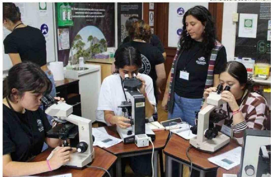
EL PRINCIPAL OBJETIVO DE LA ESCUELA ES GENERAR UN ESPACIO DE EXPERIMENTACIÓN Y DIÁLOGO PARA JÓVENES INTERESADOS EN LA CIENCIA Y EL MEDIO AMBIENTE.

El principal objetivo de la escuela es generar un espacio de experimentación y diálogo para jóvenes interesados en la ciencia y el medio ambiente. Es la primera vez que se realiza esta Escuela y