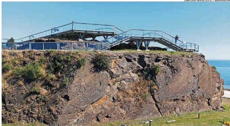
LA CANCAGUA CARACTERÍSTICA DEL MUSEO DE SITIO CASTILLO DE NIEBLA, QUE SE PUEDE VISITAR CON ENTRADA LIBERADA.

"Este libro nos permite relevar el valor de la geociencia como disciplina necesaria para producir conocimiento y enfrentar las situaciones extremas que tanto Chile como el resto del mundo vive, en relación con el cambio climático y que cada día más nos obligan a generar propuestas para frenarlo y para proteger