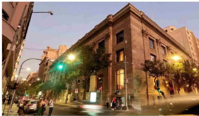
EVOLUCIÓN DE LA ACTIVIDAD DE ECONOMÍA