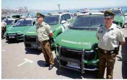
LAS POLICÍAS ZAFARON DEL COMENTADO “EFECTO REBOTE”.

“aunque el ajuste presupuestario busca mantener la disciplina fiscal, es evidente que el país enfrenta desafíos significativos que podrían llevar a nuevos recortes si no se toman medidas proactivas para abordar estos problemas estructurales”. Y opina que “la implementación de reformas fiscales y una gestión más eficiente del gasto son esenciales para evitar un deterioro adicional en los servicios públicos y asegurar el bienestar social a largo plazo”.