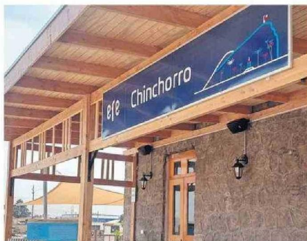
UN PANORAMA CON MUCHA IDENTIDAD.

verano. Desde una recién inaugurada Estación Chinchorro, recuperada con una mirada de cuidado patrimonial para mejorar las condiciones de la estación y su andén, podrán iniciar un viaje por la historia y