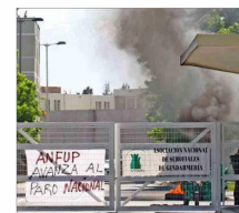
Personal penitenciario protesta en la entrada del establecimiento de la Región de O'Higgins.

Recriminaciones cruzadas agudizan la crisis oficialista. Jefe de bancada del FA remarca que el acusado no es de sus filas, luego de que extimón del PS reprochara el "amateurismo" para afrontar el problema.