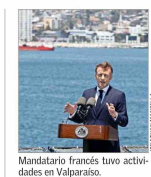
Mandatario francés tuvo actividades en Valparaíso.

Presidente Macron recibe carta de congresistas UDI por refugio en Francia de exfrentista condenado por el crimen del senador Guzmán | C 3