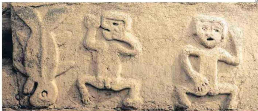
LAS OBRAS ARQUEOLÓGICAS FUERON NOMBRADAS 'LA DANZA DE LA MUERTE Y DE LA VIDA'.

vivieron, sobre las dificultades enfrentadas por el cambio climático y la escasez del agua y de los alimentos", agregó la información difundida.