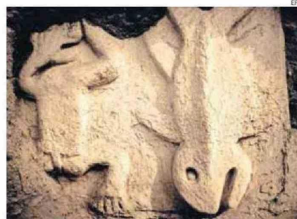
LAS TIERRAS SE VOLVIERON ARENALES Y LOS RÍOS SE SECARON.