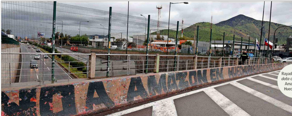
Rayado contra data center de Amazon en Huechuraba

En 2023, Chile aumentó su capacidad de infraestructura de datos en un 20%