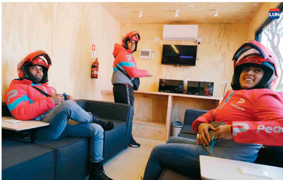
Cómodos sillones, un televisor, microondas para calentar la comida y mesas al aire libre disponen los repartidores en La Reina.

La solución que les permite hacer una necesaria pausa a los repartidores fue creada por la startup chilena Wobe y este miércoles en La Reina sumó su tercer espacio en la Región Metropolitana: los otros dos están en Lo Barnechea, sector Los Trapenses, y en Las Condes, en la Rotonda Atenas. “Nos ubicamos en la zona oriente primero porque es donde trabaja