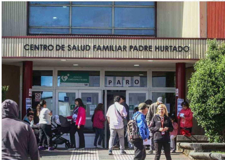
EL PRESIDENTE REGIONAL DE LA CONFUSAM LAGO LLANQUIHUE, EXIGE QUE EL GOBIERNO DISPONGA DE MÁS RECURSOS PARA LA SALUD MUNICIPAL. (viene de la página anterior)

Además, desde hace bastante tiempo, buscan modificar la Ley del Estatuto al Usuario o Ley de Trato Usuario, una asignación que tiene el sector asociada al mejoramiento de la calidad de trato al usuario para los funcionarios regidos por el estatuto de atención primaria de salud municipal.