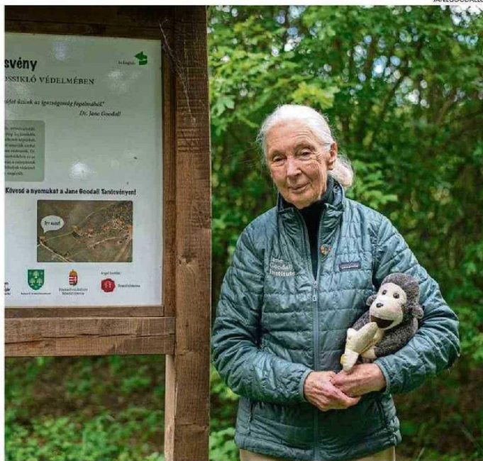
LA ETÓLOGA HA DEDICADO SU VIDA A DEFENDER EL CUIDADO DE LA NATURALEZA Y LOS ANIMALES.

A los pocos meses de llegar a ese país conoció a Louis Leakey, un famoso antropólogo y paleontólogo, quien, en ese momen-