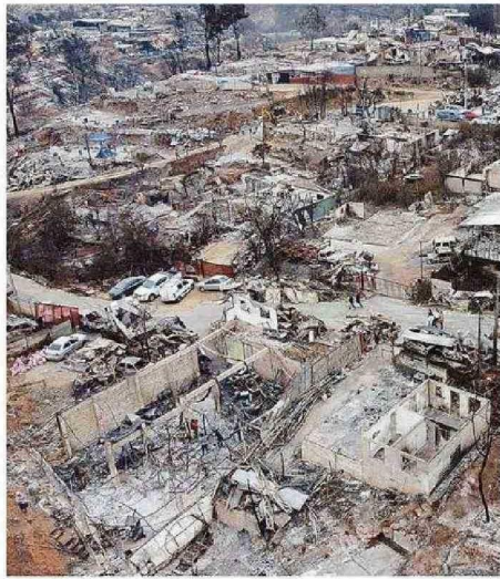
DEVASTACIÓN EN VILLA INDEPENDENCIA TRAS EL MEGAINCENDIO.