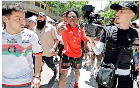
Darren Jason Watkins Jr, conocido como Speed (al centro), junto a su equipo durante su transmisión en vivo por las calles de Santiago el pasado 23 de enero.

do un fenómeno que, si bien ya tenía una base consolidada, experimentó una aceleración significativa en el mundo pospandemia".