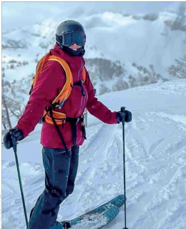
CAPTURA DE PANTALLA

Argerich había estudiado en la misma escuela del complejo donde daba clases. Aprendió desde pequeña, por