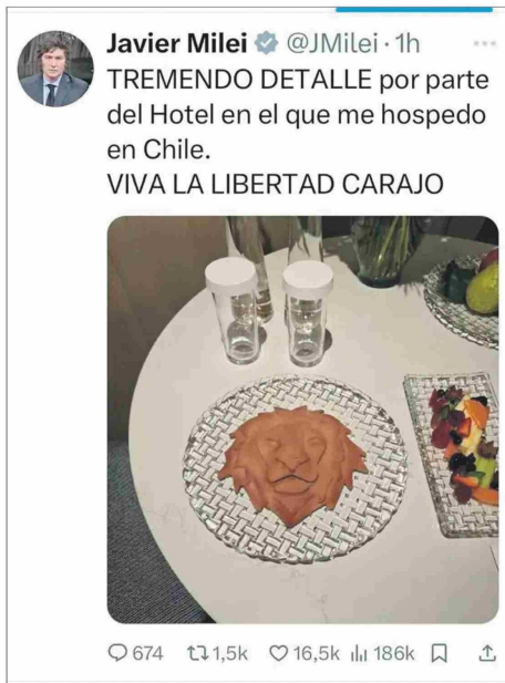
Un león de chocolate y frutas sorprendieron a Milei.

envío del primer TCF (Trillion cubic feet, sigla en inglés de trillón de pies cúbicos) de gas natural desde Argentina a Chile, a través de la Cordillera de los Andes, desde la localidad trasandina de La Mora en la provincia de Mendoza, hasta la comuna de San Bernardo en nuestro país. Un TFC es equivalente a 28.500 millones de metros cúbicos de gas natural y se alcanzó a 27 años de la inauguración del gasoducto el 7 de agosto de 1997 durante los gobiernos de Carlos Menem y Eduardo Frei, quien recibió un reconocimiento. Milei además se reunió con Eduardo y Hugo Eurnekian, de la Corporación América, holding multinacional donde laboró como economista hace algunos años.