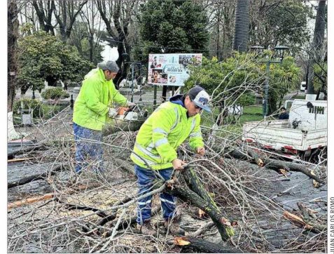
ÁRBOLES SOBRE EL TENDIDO ELÉCTRICO.—Constitución (Maule) fue una de las múltiples localidades del país afectada por pérdida del suministro.

y atendiendo el problema, aquí ha habido una omisión de coordinación de distintos actores, entre ellos, las municipalidades, que también tienen responsabilidades, porque la ley les entrega la potestad de aseo, ornato y mantenimiento de bienes de uso público”.