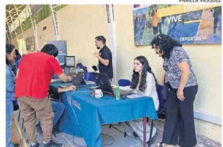
ESTUDIANTES ACOMPAÑADOS DE SUS FAMILIAS LLEGARON A LA UDA.

"Yo hago una evaluación positiva, porque estamos viendo la demanda de la comunidad, el interés en participar de nuestro proceso como Universidad. Hemos posicionado