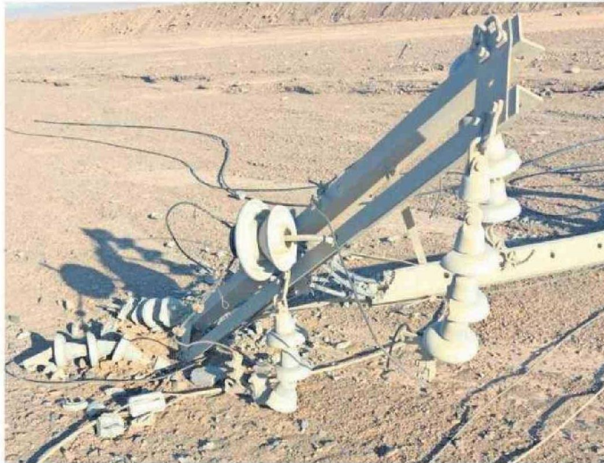
LOS DELINCUENTES ROBARON MÁS DE 5 KILÓMETROS DE CABLE EN LA COMUNA DE SIERRA GORDA.

"El pasado 11 de diciembre, ocurrió un robo con características similares que afectó directamente a Baquedano, poblado