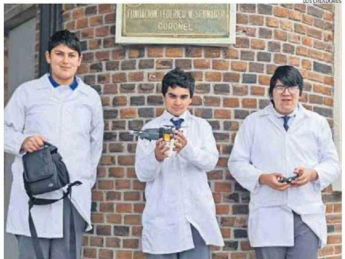
EN BIOBÍO DESARROLLARON DRONES PARA LLEVAR MEDICAMENTOS A PERSONAS CON MOVILIDAD REDUCIDA.