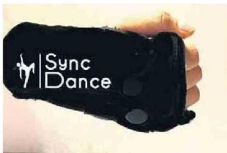
"SYNC DANCE", PROYECTO DEL MAULE, AYUDA A BAILAR A PERSONAS CIEGAS.

gas para evitar alguna explosión. Este sensor detecta gas licuado, metano y propano. En caso de existir una fuga, envía una alerta por vía SMS a los usuarios informando y evitando una posible catástrofe", revela la joven, que se declara apasionada de la computación.