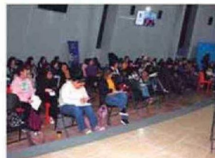
Personas presenciaron y fueron participantes de la Obra de Teatro LOS MAZALEZ en Iquique.