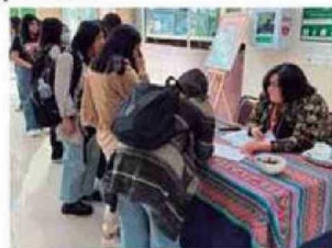
Personas presenciaron y fueron participantes de la Obra de Teatro LOS MAZALEZ en CFT Arica.