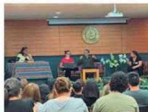
Personas presenciaron y fueron participantes de la Obra de Teatro LOS MAZALEZ en Santo Tomás Arica.