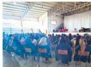
Personas presenciaron y fueron participantes de la Obra de Teatro LOS MAZALEZ en La Serena.