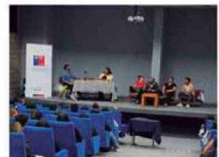
Personas presenciaron y fueron participantes de la Obra de Teatro LOS MAZALEZ en UTA Arica.