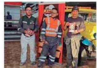
Personas presenciaron y fueron participantes de la Obra de Teatro LOS MAZALEZ en Calama.