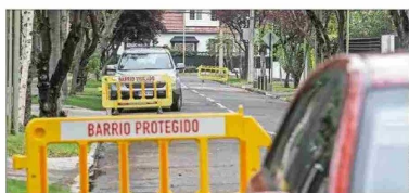
Las medidas de seguridad deben involucrar un esfuerzo mancomunado entre diversas instituciones, plantean especialistas.

Añade que "luego la estrategia debe considerar incentivos económicos para las familias y municipios para la reinserción escolar de jóvenes desahuciados, instalación de 'oficinas de oportunidades laborales' de cooperación público-privada para dar trabajos lícitos a jóvenes y adultos".