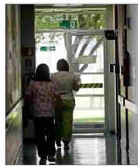
Actualmente, hay 2,5 millones de prestaciones atrasadas.

Otra propuesta, indica Sánchez, es "flexibilizar en forma inteligente la gestión médica para incentivar el trabajo fuera de horarios normales, sujeto a normas e incentivos claros y bien gestionados y supervisados para evitar el abuso", y "resignar más recursos a establecimientos que claramente lo requieren, pero amarrados a cumplimiento de indicadores y metas, sancionando el incumplimiento".