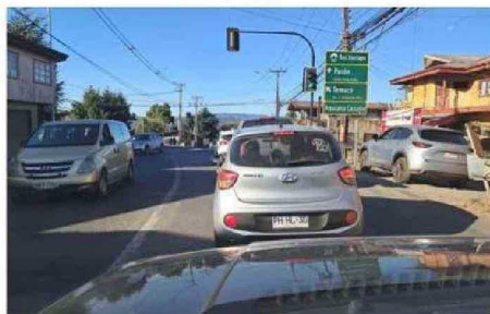
TACOS ESTRESANTES SON PARTE DEL DÍA A DÍA EN VERANO EN VILLARRICA.

$14 mil millones se destinó, desde el MOP, para el arreglo completo de lo que será la Gran Avenida Segunda Faja de Villarrica en una extensión de 2,5 kilómetros, hoy con un avance del 88 por ciento.