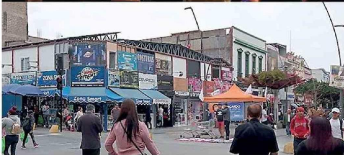
EL INCENDIO DE NOVIEMBRE DE 2019 CONSUMIÓ LA ANTIGUA CRUZ VERDE Y LA ESTRUCTURA SUPERIOR DEL EDIFICIO DE BAQUEDANO. HOY ALBERGA LOCALES COMERCIALES DE DISPOSITIVOS ELECTRÓNICOS.

de Mejillones para que mandaran unidades para acá. Es día tuvimos 13 incendios en forma simultánea y ver a Antofagasta destruida de esa manera, porque también destruyeron los asientos de cemento en calle Maipú, era igual que una batalla, como si hubiesen tirado una bomba, fue horrible”.