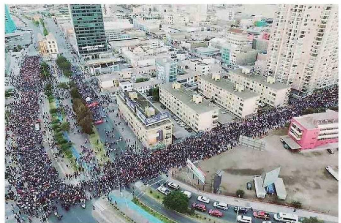
25 DE OCTUBRE DE 2019: LA MARCHA MÁS MASIVA EN LA HISTORIA DE ANTOFAGASTA.

“El Estallido Social es una herida abierta”, sentencia Sánchez y explica que “el daño que se sufrió todavía es visible en el centro y persiste la visión de algunos locales que fueron saqueados, incendiados y desaparecieron. Están todavía los rayados y las medidas de seguridad que implementaron todavía muchos locales las mantienen como el cierre de las vitrinas que ya no se han vuelto a ver, además del daño económico que se produjo por la violencia y que se ahondó más con la Pandemia”.