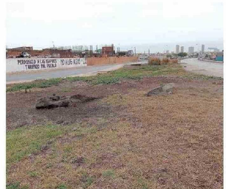
CINCO AÑOS DESPUÉS, DONDE ESTABA EL LETRERO DE “BIENVENIDO ANTOFAGASTA”, SÓLO QUEDAN LOS SOPORTES.