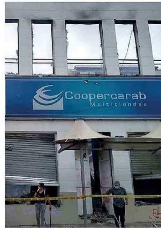
LA ANTIGUA COOPERCARAB TAMBIÉN FUE DESTRUIDA. HOY EL LUGAR ALBERGA ESTE LOCAL COMERCIAL.