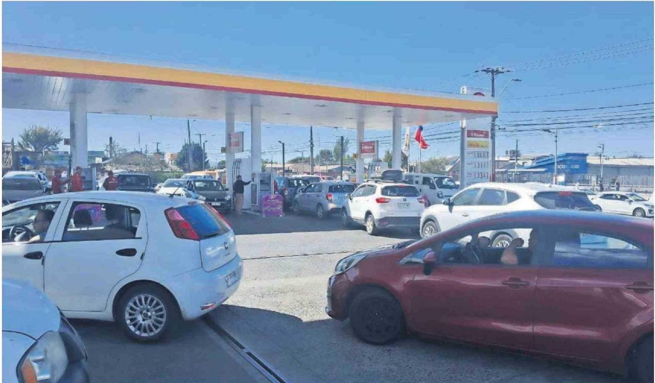
LA IMAGEN CORRESPONDE A UNA ESTACIÓN DE SERVICIO DE LA COMUNA DE TALCAHUANO, LA CUAL, COMO MUCHAS OTRAS DEL PAÍS SE VIERON COLAPSADAS POR LA GRAN DEMANDA DE LOS CONDUCTORES.

Bencineras, paraderos y algunas calles colapsadas fue el escenario con que se encontraron las personas tras el masivo apagón que ayer afectó a gran parte del país y también a nuestra Región del Biobío. Se decretaron medidas especiales.