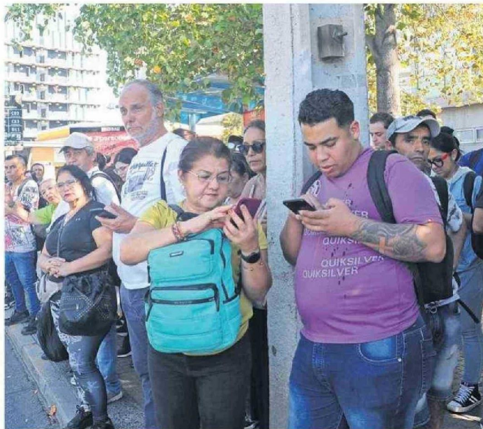
PERSONAS TRATANDO DE ABORDAR MICRO LUEGO DE SALIR DE SUS LUGARES DE TRABAJO.

gía de la Universidad Católica de la Santísima Concepción, puntualizó que "el corte de suministro eléctrico se produjo por una falla en la línea de transmisión de 500 kV en la zona del norte chico, lo que desencadenó un blackout que afectó al sistema eléctrico nacional, abarcando gran parte del norte, centro y sur de Chile".