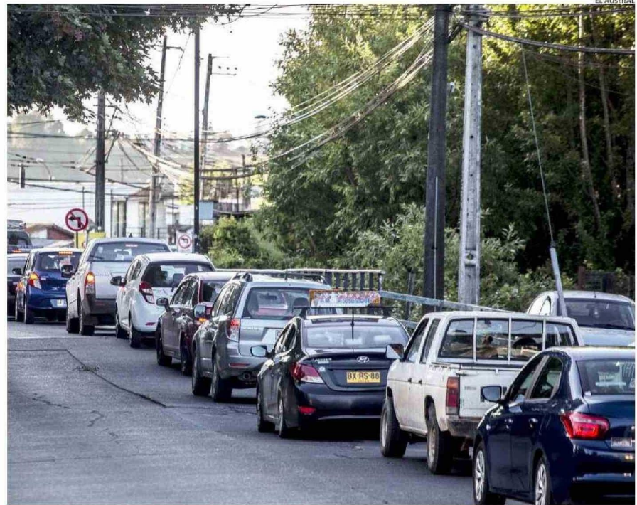
EL FLUJO VEHICULAR EN LA COMUNA ES MUY SUPERIOR A LA CAPACIDAD VIAL, LO QUE GENERA ALTA CONGESTIÓN EN HORARIOS PUNTA.