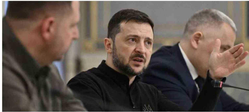
El Presidente ucraniano, Volodímir Zelenski, llegó a Bruselas para participar del Consejo Europeo.

Un ataque masivo ucraniano con drones causó un