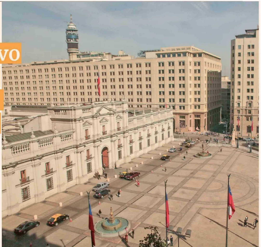
RESULTADO EFECTIVO DEL GOBIERNO CENTRAL

"Los ingresos proyectados para este año, basados en una estimación excesivamente optimista para 2024, tienen el mismo problema de sobrestimación, y si no se corrige el gasto con un ajuste bastante más significativo que el anunciado, la estimación de déficit para este año tampoco se cumplirá", anticipa.