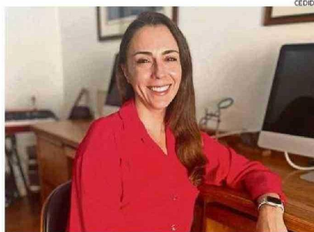
Churruca es una de las autoras y magíster en neurociencias.

En esa línea, la especialista plantea que "a diferencia de otros métodos como la saliva, la orina o la sangre, el análisis de uñas permite evaluar el estrés acumulado durante un período prolongado. Esto lo convierte en una herramienta más fiable para en-