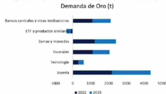
Figura 2. Principales usos del oro a nivel global (cifras en toneladas).