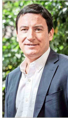
Arturo Squella, presidente del P. Republicano.