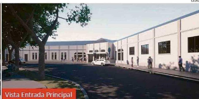
Vista Entrada Principal