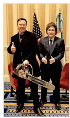
El mandatario de Argentina, Javier Milei, al igual que chilenos del Partido Nacional Libertario, está en EEUU para participar en la Conferencia de Acción Política Conservadora. El gobernante le regaló a Musk una réplica de su icónica motosierra.

Asimismo, el titular de Hacienda aduce que los recursos solicitados en 2023 a la corporación fueron necesarios porque hubo otros ingresos "que estuvieron por debajo de lo presupuestado". | B 2 y C 2