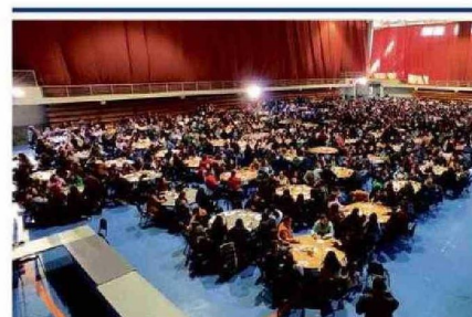
• El DAEM Puerto Montt, en colaboración con el Instituto de Seguridad del Trabajo (IST) , organizó una capacitación en Arena Puerto Montt para más de 1500 funcionarios de 76 establecimientos, jornada se enfocó en la gestión de conflictos y autocuidado en el entorno laboral.