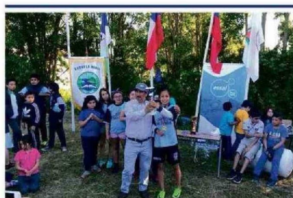
• 8 escuelas rurales multigrado del DAEM de Puerto Montt organizan y participan en las olimpiadas rurales, que tienen como objetivo potenciar el sentido de pertenencia de la comunidad educativa, con la participación de las escuelas del microcentro, en actividades; recreativas, deportivas, culturales y pedagógicas.