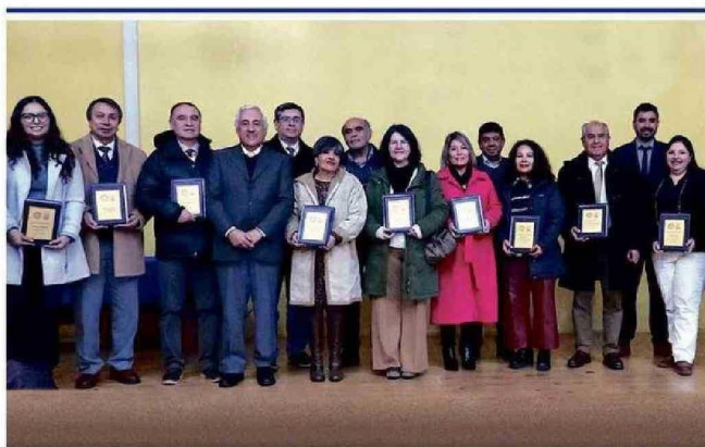
• Escuelas, colegios y liceos municipales destacan por su excelencia académica. El DAEM de Puerto Montt reconoció a 39 establecimientos educacionales por sus destacados resultados académicos en SNED (Sistema Nacional de Evaluación de Desempeño) y SIMCE, resaltando el compromiso de las comunidades escolares con la mejora continua de la educación pública.