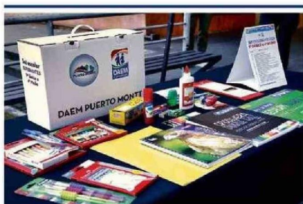
• 20.815 estudiantes municipales de la capital regional recibieron sus cajas de útiles escolares de forma gratuita, considerando una inversión de $978 millones de pesos financiados con recursos de la Subvención Escolar Preferencial.