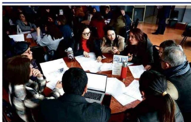
• El DAEM Puerto Montt organizó una jornada de evaluación del Plan de Desarrollo Educativo Municipal (PADEM) 2024 que contó con la participación de más de 200 personas. Equipos directivos, gremios educativos, centros de padres, apoderados y líderes estudiantiles colaboraron en la planificación del futuro educativo de la comuna rumbo al año 2025.