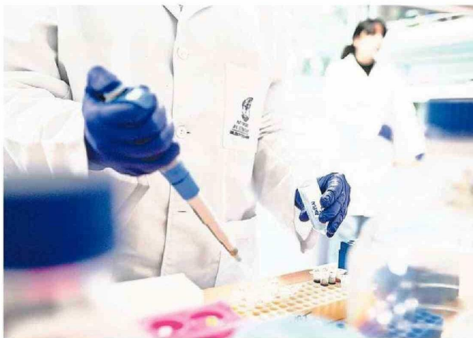
La USS está potenciando varias líneas de investigación estratégicas con el objetivo primario de fortalecer la calidad académica y la formación de pregrado, y también para tener impacto en el ámbito científico y en el bienestar social y desarrollo del país.

La USS ha dado un salto considerable en el ranking, pasando del puesto 21 en la edición del año 2023 al puesto 10 en 2024, siendo esta la primera vez que ingresa al top 10 de instituciones universita-