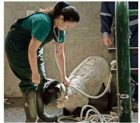
EN LA PASADA TEMPORADA DE INCENDIOS FORESTALES, EL COLEGIO DE MÉDICOS VETERINARIOS ATENDIÓ A 5.524 ANIMALES AFECTADOS.