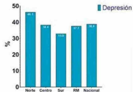
PREVALENCIA DE DEPRESIÓN POR MACROZONA Y NACIONAL.

de inseguridad severa con 8,5%, seguido por el sur con 3,5%, la Región Metropolitana con 62,8% de normalidad, 31,3% de riesgo de desnutrición y 5,9% de desnutrición. Luego viene la zona centro con 64,1% de normalidad, 29,1% de riesgo y 6,8% de desnutrición. Y la situación menos crítica se ve en la zona sur con 65,5% de normalidad, 30,5% de riesgo y 4% de desnutrición.