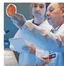
El parche en fase de prueba.

"Estudiamos las propiedades antimicrobianas de ciertas proteínas de origen bacteriano, así como también propiedades regenera-