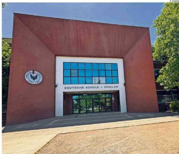
COLEGIO ALEMÁN DE CHILLÁN FUE UNO DE LOS ESTABLECIMIENTOS CON MEJORES RESULTADOS.

"Estos resultados son reflejo del esfuerzo de nuestros