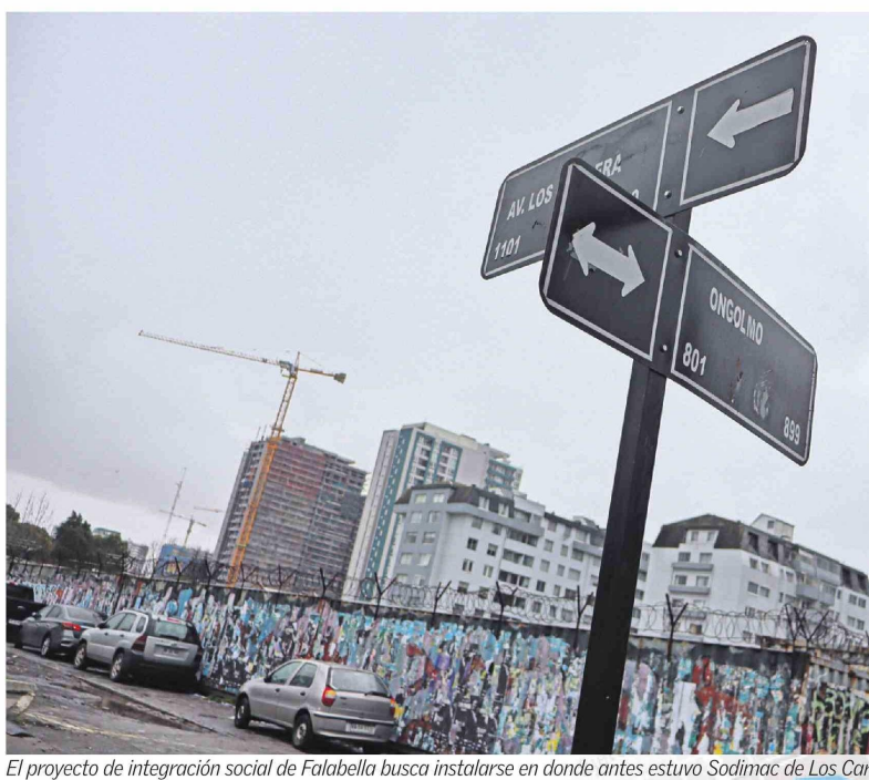
El proyecto de integración social de Falabella busca instalarse en donde antes estuvo Sodimac de Los Carrera.