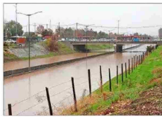
La vicepresidente Carolina Tohá (izquierda, arriba) recorrió ayer Curanilahue, la comuna más afectada en el sur por el temporal, donde los vecinos reclamaron una pronta reposición del servicio de agua potable. En tanto, fuertes críticas surgieron luego que un nuevo episodio de inundación del paso bajo nivel de la avenida Teniente Cruz en Pudahuel restringiera el uso de la Ruta 68 (izquierda, abajo). En la Región del Biobío el desborde del río Andalién causó serios trastornos incluso en la capital regional, Concepción (foto principal). El alcalde Álvaro Ortiz informó que hay 150 viviendas afectadas por el ingreso de aguas de ríos, canales cercanos o filtraciones.