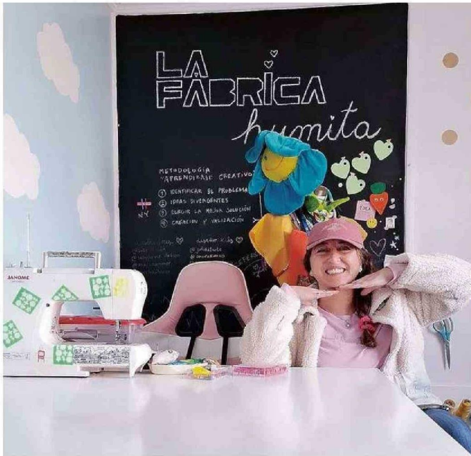
EN EL CENTRO CULTURAL ABRIRÁ SU TALLER "HUMITA" PARA SEGUIR PROMOVIENDO LA CREATIVIDAD.

-Sacamos como conclusión que el proyecto es exportable. Hay que hacerle algunos arreglos que ya los estoy trabajando, también tener listas algunas traducciones de los pasos y mostrar más sobre Chile y