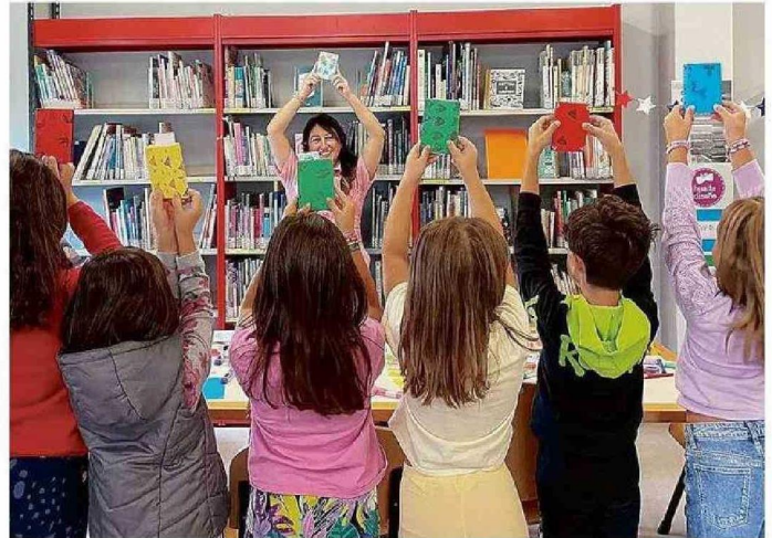
UNO DE SUS TALLERES DE DISEÑO SUSTENTABLE EN LA BIBLIOTECA CHIESAROSSA EN MILÁN, ITALIA.

haciendo cosas. Entonces me volví experta en crear objetos (rír). Ellos se sienten identificados en que con las cosas simples que tienen pueden crear. Desde ahí parte el proceso y no paran. Cuando terminan su producto, en este caso realizaron la encuadernación, crearon un personaje, el libro y un muñeco en la misma línea. Después no se quieren ir, desean seguir pintando y agregándole detallitos, cosas así.